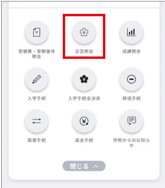
画面・デザイン等は変更になる可能性があります。

③ ページ下部にある「振込用紙を印刷する」を選択し、振込依頼書をダウンロードしてください。